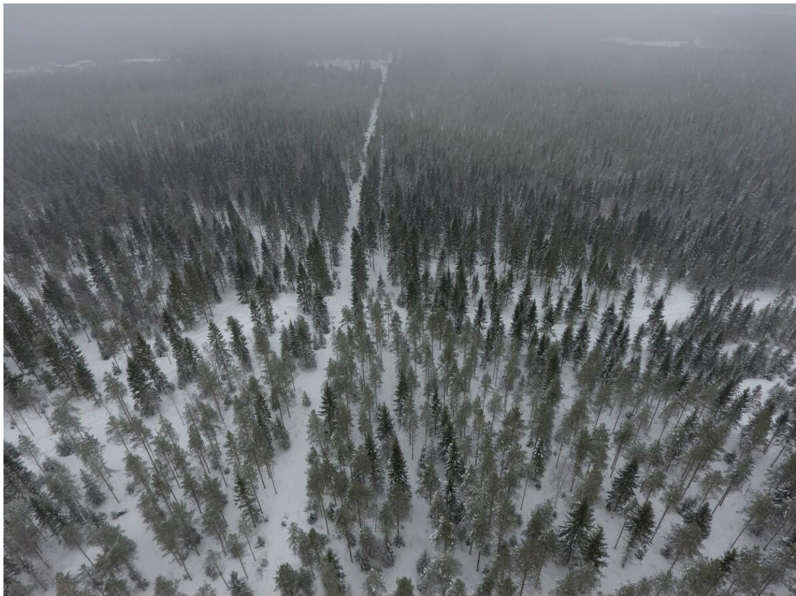
kuviot 10, 11 ja 12 ilmasta johtolinja kulkee palstan läpi